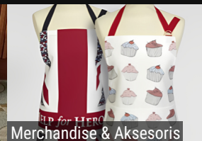
Merchandise & Aksesoris