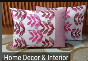
Home Decor & Interior