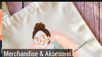
Merchandise & Aksesoris