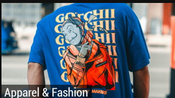
Apparel & Fashion