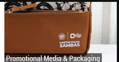
Promotional Media & Packaging