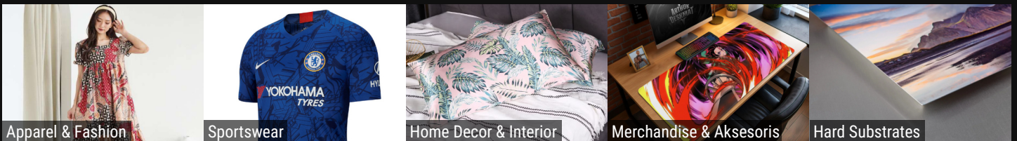
Apparel & Fashion