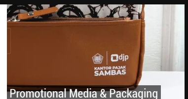
Promotional Media & Packaging