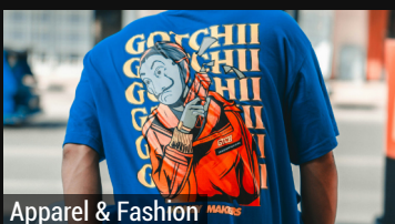
Apparel & Fashion