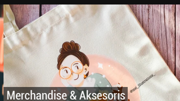
Merchandise & Aksesoris