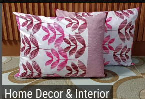
Home Decor & Interior