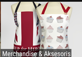
Merchandise & Aksesoris